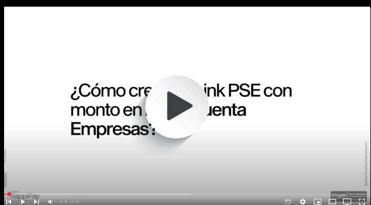
Crear un Link PSE con monto en RappiCuenta Empresas