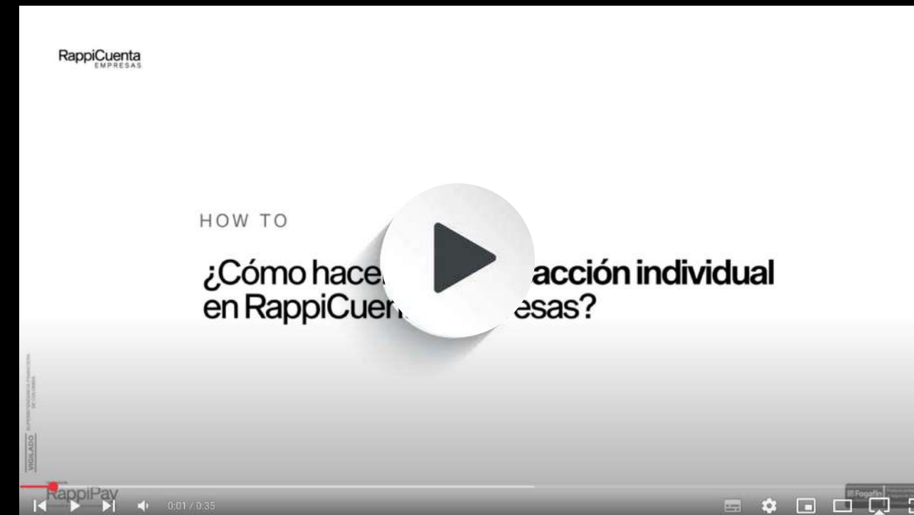
Transacción individual en RappiCuenta Empresas