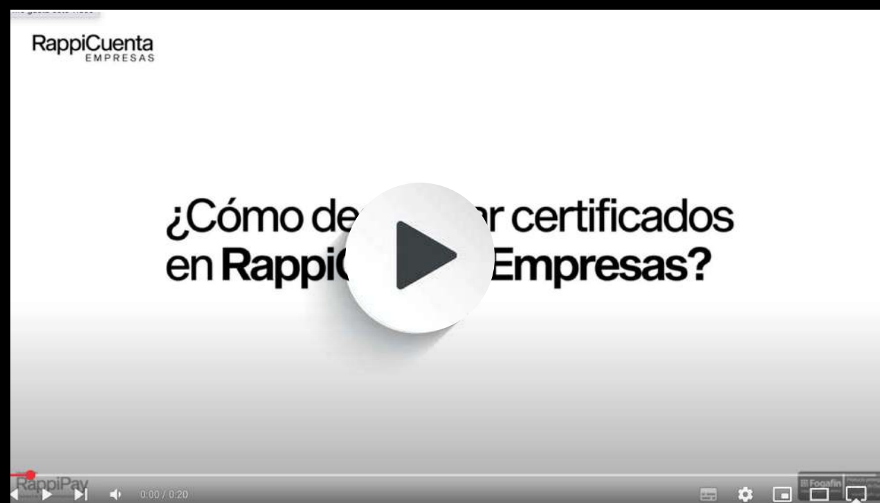
Descargar certificados RappiCuenta Empresas