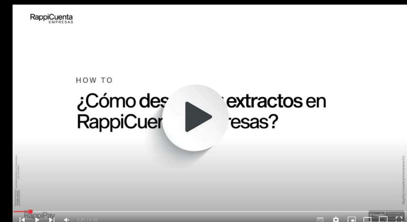
Descargar extractos en RappiCuenta Empresas