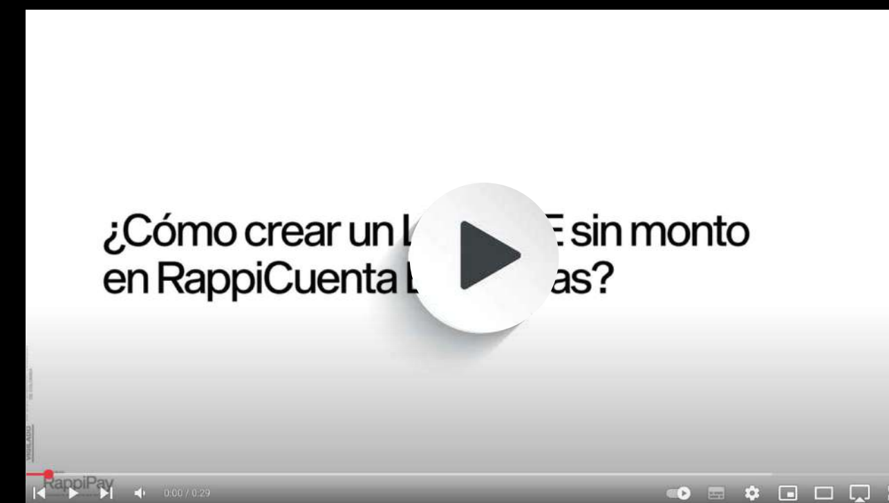
Crear un Link PSE sin monto en RappiCuenta Empresas