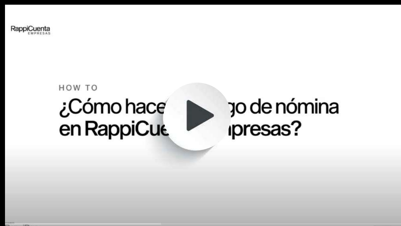
Pago de nómina en en mi RappiCuenta Empresas