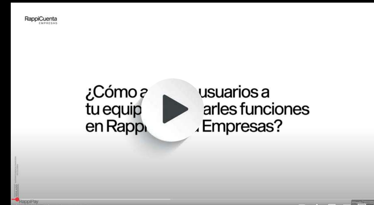
Agregar usuarios a tu equipo y asignarles funciones RappiCuenta Empresas